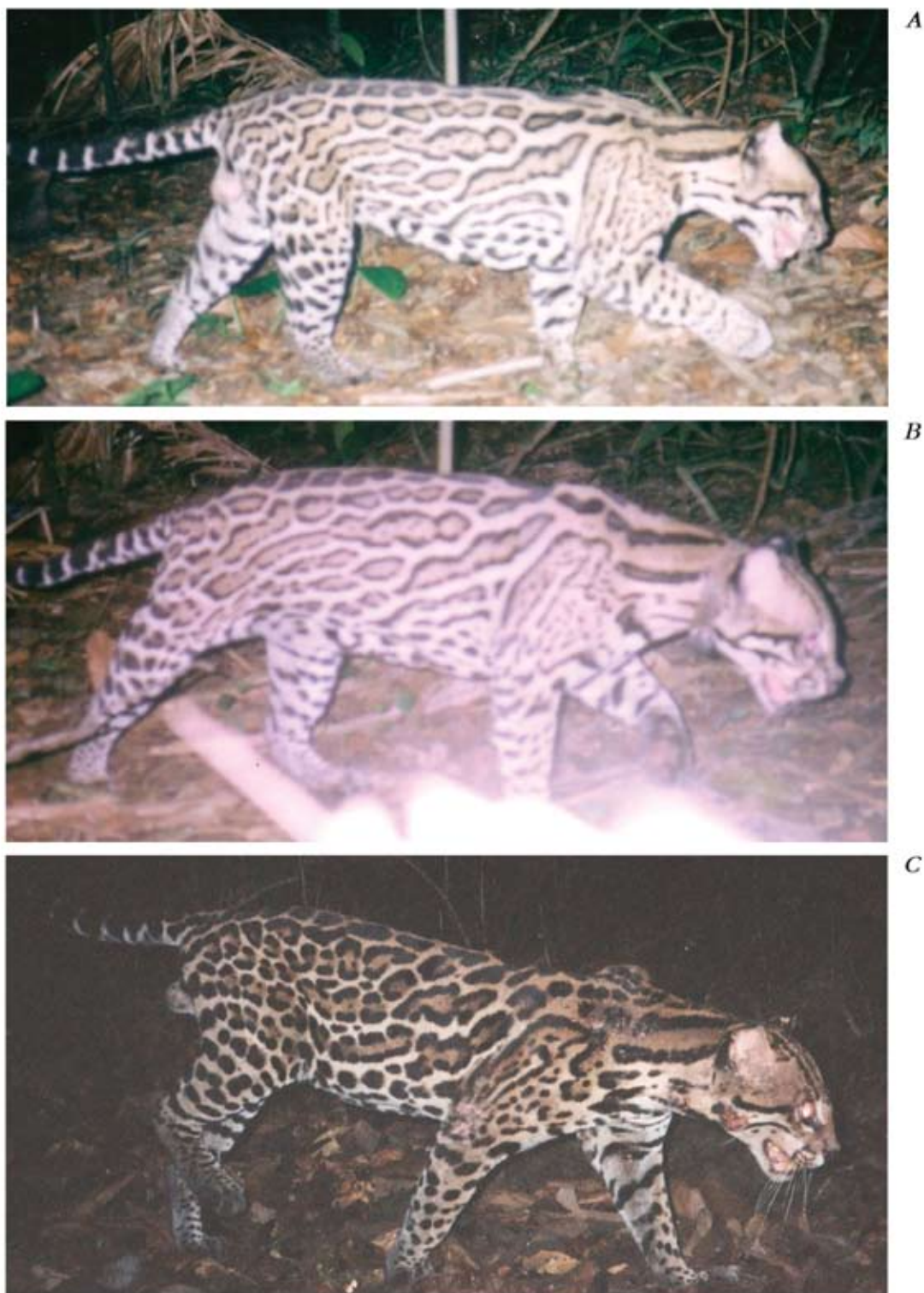
Figura 3. Fotografías de dos ocelotes machos captados con cámaras-trampa en la Isla de Barro Colorado (IBC). Fotos A y B es el mismo individuo (Bob), foto B muestra a Bob con radio-collares. En la foto C (Vag), se observa con patrones de machas diferentes a Bob.