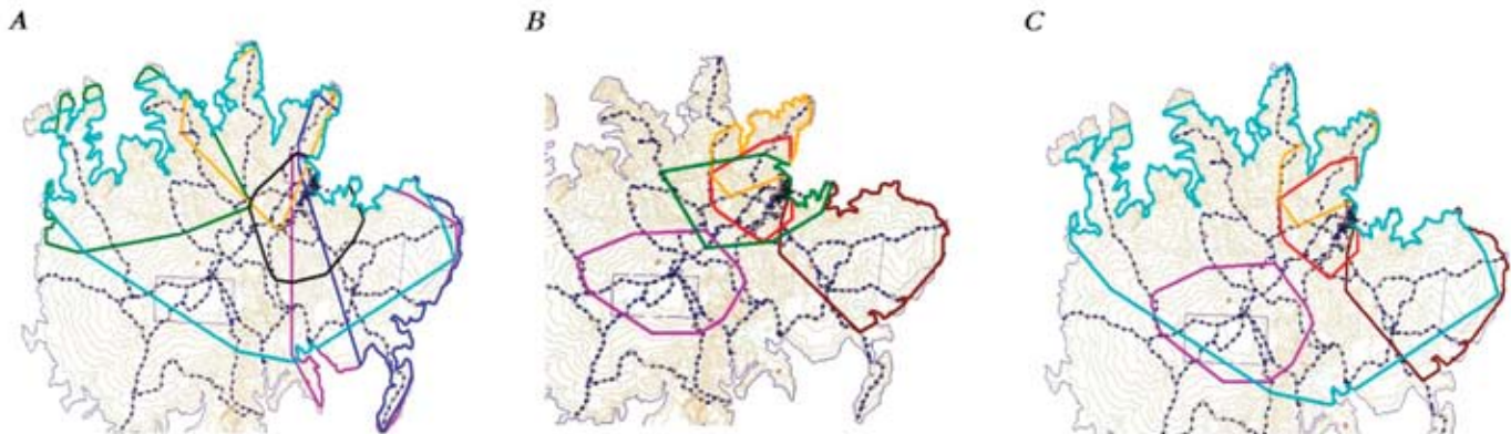
Figura 2. Ámbitos hogareños y distribución espacial de ocelotes con radio collares estudiados en la Isla de Barro Colorado (IBC). Basado en radiotelemetría Polígono Mínimo Convexo 100%. A) Machos: Color celeste = Bob; negro = Enc; verde = Bar; naranja = Mot; morado = Geo; azul = Isa. B) Hembras: morado = Yar; verde = Est; chocolate = Fra; rojo = Ore; naranja = Man. C) Cuatro hembras adultas (naranja = Man; rojo = Ore; chocolate = Fra; morado = Yar) dentro del área del macho Bob (línea de color celeste).

en las noches distancias de 1.15 km en promedio ( n = 79 ), con un máximo de 3.76 km y un mínimo de 0.03, y un registro extremo de un macho (Figura 2) que se desplazó 6.4 km (Tabla 1). Las hembras adultas recorrieron por las noches un mínimo de 0.02 km y un máximo de 2.4 km (promedio 0.7 km, n = 93 ) (Tabla 1). Mientras que los dos